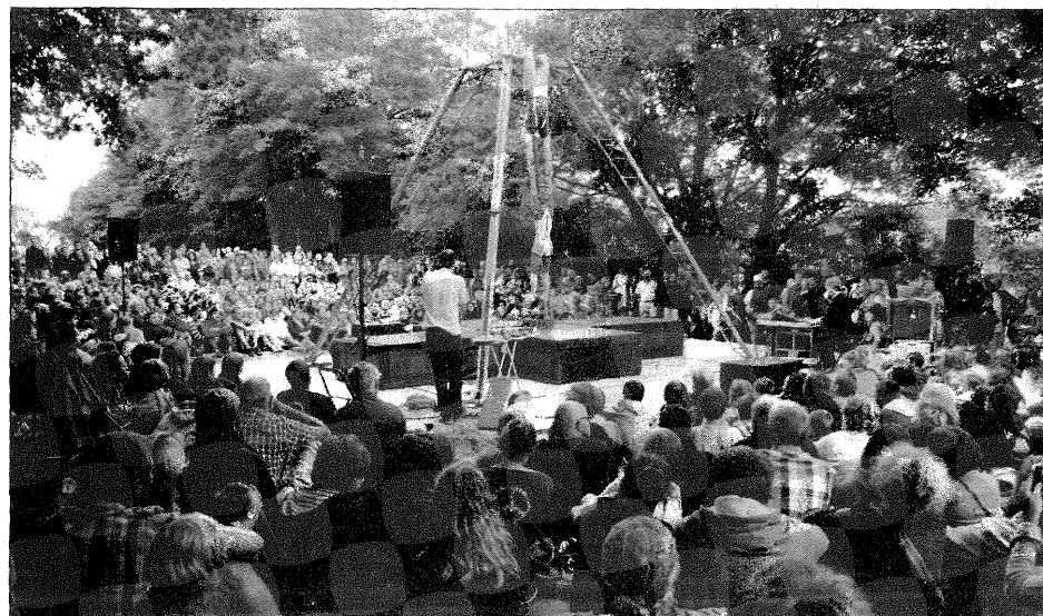
Beaucoup de monde pour La vie tendre et cruelle des animaux sauvages.

sommes fans du cinéma muet. Nous avons trouvé l'idée sympa de transformer l'histoire du film Le cirque en un spectacle et de remplacer le dompteur par un homme fort toujours sur le principe d'un film muet avec un accompagnement piano comme autrefois dans les cinémas avec des panneaux pour faire participer le public et plein de petites choses pour développer notre histoire dans un décor en noir et blanc.